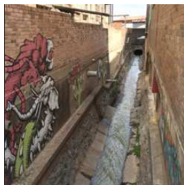
Pequeño canal en calle commercial con arte callejero