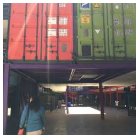
Pueblo container en Melville cerca de Agterplaas

Precio total del transfer de Johannesburg al hotel Agterplaas: ZAR 450.00 por vehículo (4 personas por vehículo) – a ser pagado en el momento del transfer.